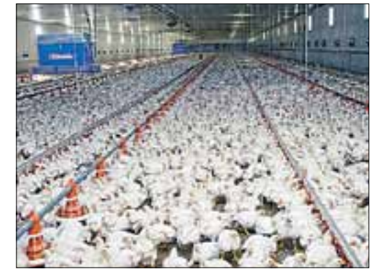
Höhere Kosten sind abzugelten