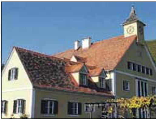
Silberberg strebt internationalen Ruf an