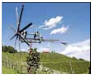
Reben und Legenden ARCHIV

ZDF NEO Was essen wir morgen? Samstag, 3. März, 18.45 Uhr. ARTE Das Ende des Atomzeitalters? Dienstag, 6. März, 20.15 Uhr. ARTE Achtung Erdbeben! Das Frühwarnsystem der Tiere. Donnerstag, 8. März, 22.15 Uhr. ORF 2 Land und Leute. Samstag, 10. März, 15.40 Uhr. ORF III Reisen und Speisen: Das Uhudlerland. Freitag, 9. März, 10.50 Uhr.