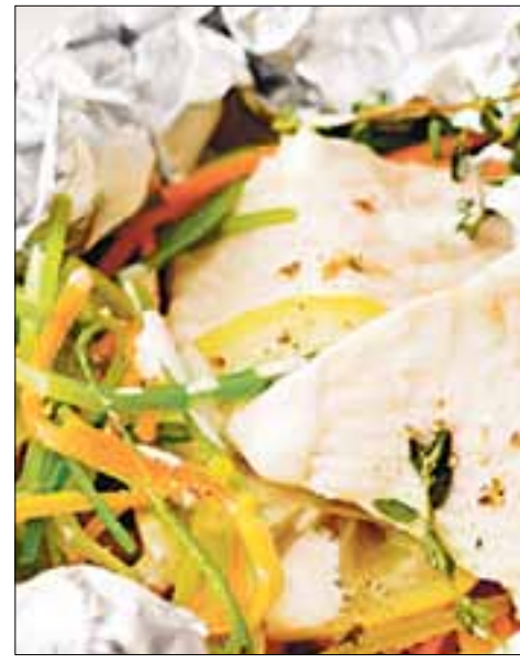
Fasten kann so lecker sein! WWW.WENIG.DE

Lauch, Karotten, Sellerie und Fenchel fein nudelig schneiden und in etwas Butter farblos andünsten mit Sud aufgießen und bissfest weiterdünsten. Mit Zitronensaft, Salz und Pfeffer und einer Spur Zucker abschmecken, mit gehackten Kräutern und Creme fraich binden und als Bett für den Saibling anrichten.