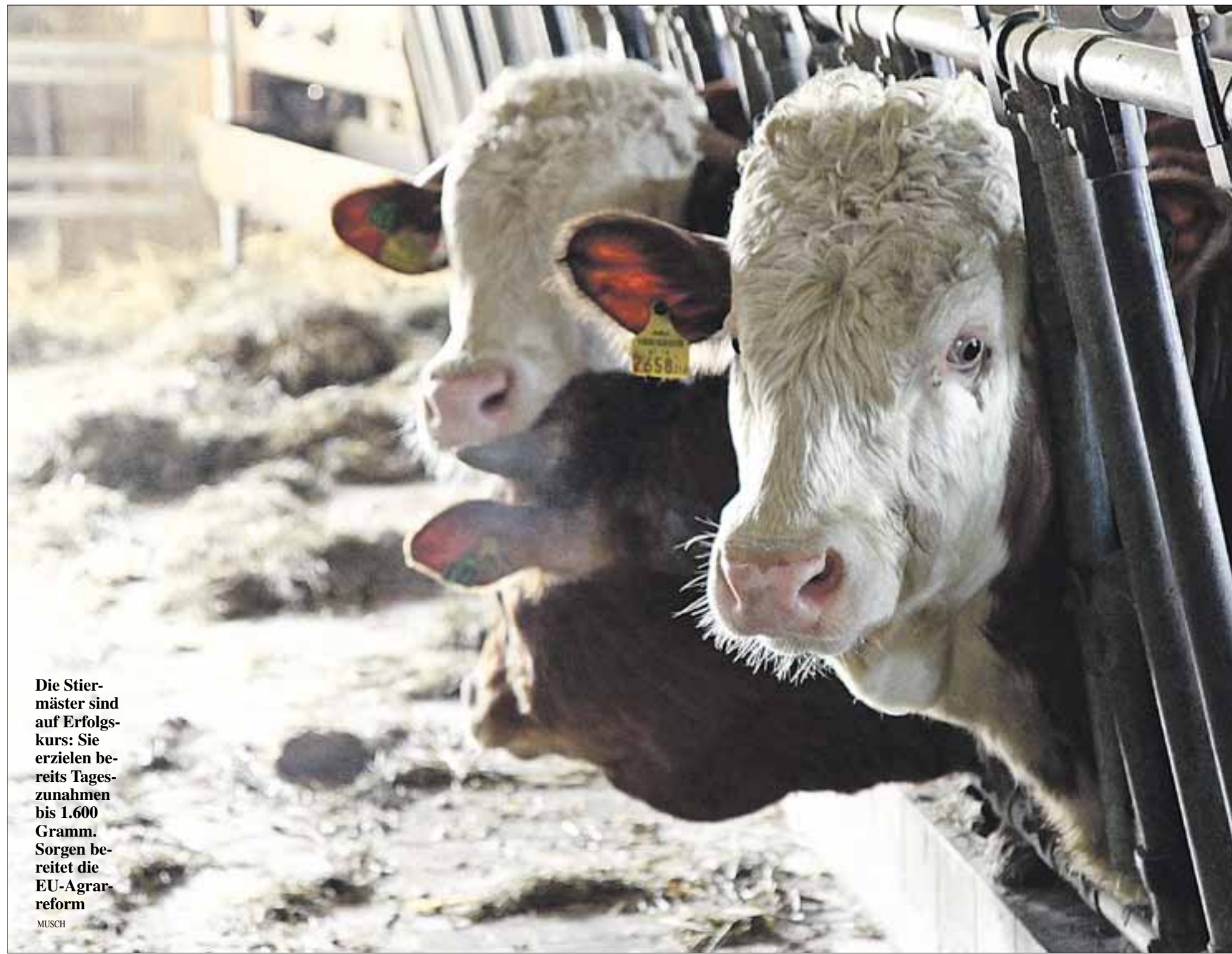
Die Stiermäster sind auf Erfolgskurs: Sie erzielen bereits Tageszunahmen bis 1.600 Gramm. Sorgen bereitet die EU-Agrarreform

Die Stiermastbetriebe sind auf den Einkauf von Kälbern angewiesen. Jedes Problem führt zu einer Verschlechterung der Wirtschaftlichkeit. Jedes eingekaufte Kalb muss gesund sein und ein gutes Leistungsvermögen haben. Die meisten Stiermastbetriebe behandeln die zugekauften Kälber gegen die häufigen Krankheiten Grippe und gegen Durchfall. Erfolgreiche Stiermäster kaufen nur gesunde Kälber. Jedes äußere Zeichen einer Erkrankung muss erkannt werden (sehr oft am Haarkleid, am Gesamtverhalten und in den Augen). Kranke Kälber, die durch Durchfall oder Lungentzündungen geschwächt sind, werden immer zurück bleiben. Weitere wichtige Merkmale für gute Kälber sind: ein gutes Wachstumspotenzial durch eine passende Genetik (Frohwichsigkeit) und das passende Gewicht für das Alter, wobei männliche Kälber, wenn sie Milch bekommen, Tageszunahmen von über 1.100 Gramm erreichen sollten. Die Arbeitskreisbetriebe zeigen, dass die Fleisch- oder Handelsklasse immer besser und