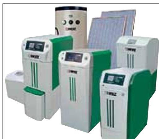
Die HERZ-Produktpalette: Alles aus einer Hand