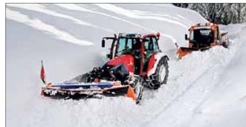
Unitrac im Winterdienst