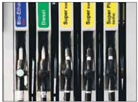
Ethanol: die Hälfte weniger Treibhausgase