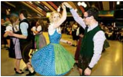
Ansteckend: Tanzen bis in die Nacht MACHER

AK AUS DER STEIERMARK VON R... MUSCH 0316/8050-1368 nder.rroman.musch@