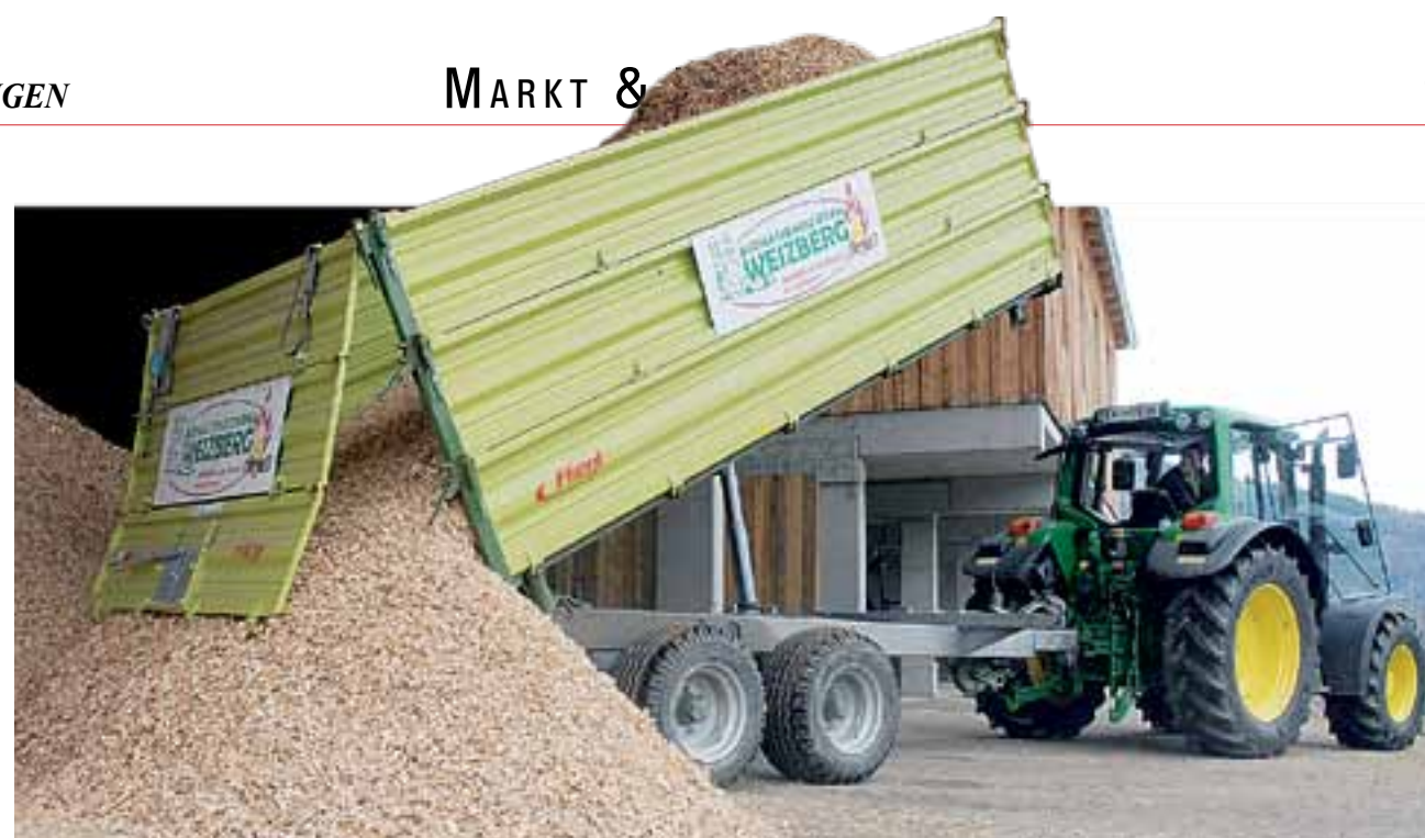
Bei kurzen Entfernungen von rund fünf Kilometern ist der Traktor am günstigsten KLAEPER