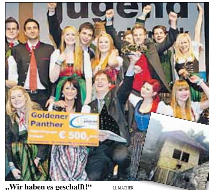
„Wir haben es geschafft!“

Doch die Gemeinschaft der Landjugend scheint so viel Energie zu geben, dass neben dem Alltag noch Zigttausende Stunden für die Allgemeinheit drinnen sind. Das ist ja das Schöne an dieser Organisation – alle, auch die, die nicht dabei sind, haben etwas davon. Dennoch fragen sich viele Mitglieder: „was hab' i davon?“. Ich habe eine Antwort: Die Landjugend kann dir zeigen, was wirklich in dir steckt!