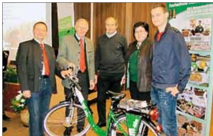
Ein E-Bike ist in Feldbachs Hügeln etwas Feines KK