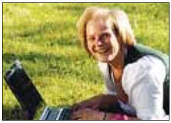
Bäuerinnen: Starke Marke KK