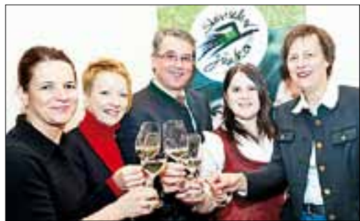
Der Junker schmeckt noch