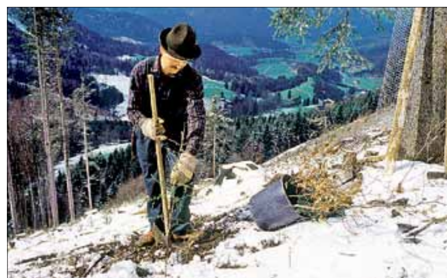
Die Arbeitsqualität ist beim Setzen entscheidend. Selbst mit schonenden Verfahren können Fehler gemacht werden BMLFUW

Der gewählte Pflanzverband ist sowohl für den ökonomischen Erfolg, durch Pflanz-, und Pflegekosten, als auch für die Stabilität und die mögliche Wertentwicklung des zukünftigen Bestandes von größter Bedeutung.