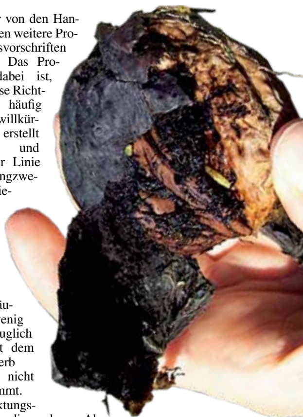
Neue Schädlinge, wie hier die Walnussfruchtfliege, halten heimische Obstbauern auf Trab. GUDRIN KROBATH

häufiger von den Handelsketten weitere Produktionsvorschriften gestellt. Das Problem dabei ist, dass diese Richtlinien häufig sehr willkürlich erstellt werden und in erster Linie Marketingzwecken dienen. Daher sind diese Auflagen auch häufig wenig praxistauglich und mit dem Mitbewerber bewusst nicht abgestimmt. Vermarktungsbetriebe, die mehrere Abnehmer beliefern, müssen von ihren Lieferanten die Einhaltung aller relevanten Vorschriften verlangen. Herbert Muster