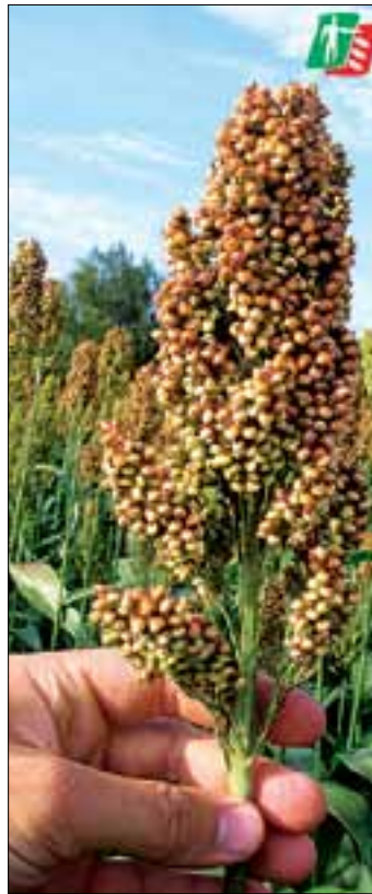
Körnerhirse Sorghum bicolor

Körnersorghum als neue Fruchtfolgealternative für Güllebetriebe