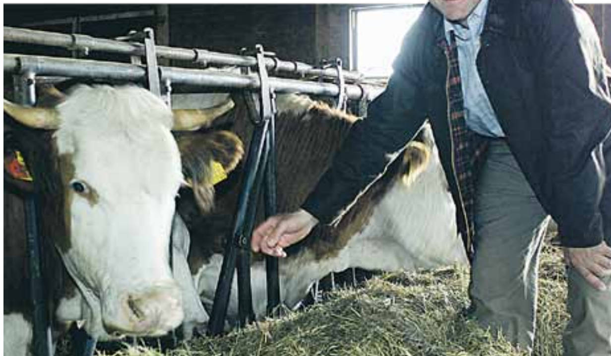
Endlich durchatmen: Produzenten können weiter auf stabile Preise hoffen