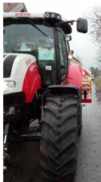
Bei drei bis 3,30 Metern Breite sind reflektierende Warnmarkierungen vorn und hinten zur Kennzeichnung der Überbreite vorgeschrieben.