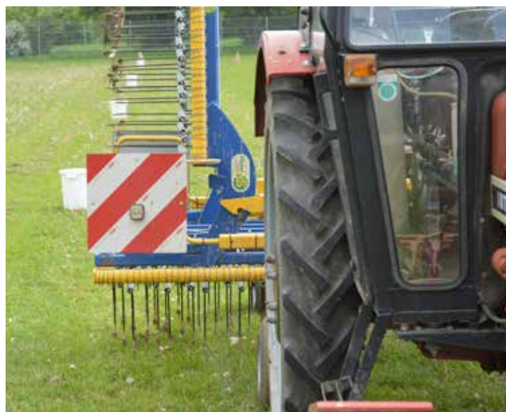
Eine Warnmarkierung ist notwendig, weil das Anbaugerät seitlich über den Traktor hinausragt.