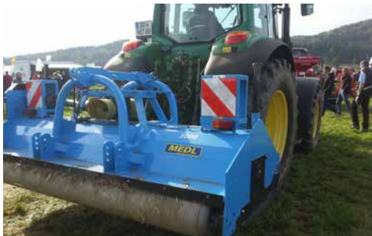
Die Streifen der Tafeln oder Klebefolien müssen nach außen abfallen.