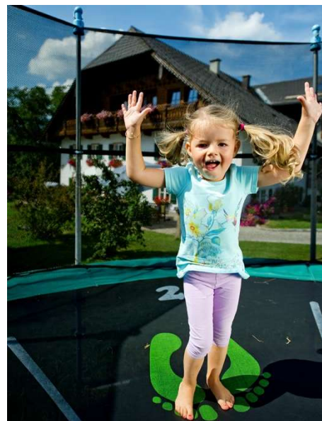
Trampoline sind bei den Gästen sehr beliebt. Das Anbringen einer „Trampolin-Ordnung“ wird dringend empfohlen.

Sehr große Produktauswahl: Die einfachste Kategorie sind aufblasbare Trampoline. Sie haben einen aufblasbaren Corpus aus hochbelastbarem Kunststoff und somit keine harten, verletzungsträchtigen Metallstreben und -rahmen wie die anderen Trampolintypen. Fitness trampoline (Gymnastik trampoline) sind meist kreisrund mit einer Sprungfläche zwischen 90 und 130 cm, die Höhen liegen zwischen 20 und 40 cm.