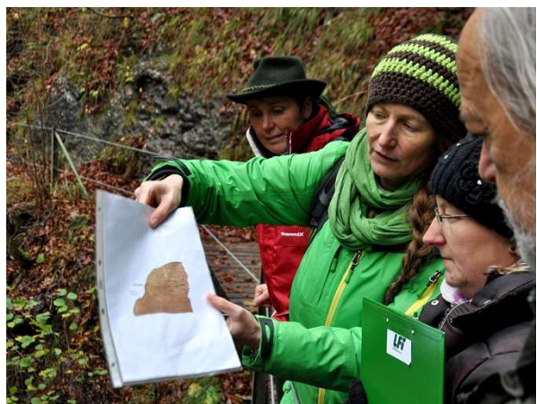
Naturvermittlung ist eine spannende Sache.

Ohne jede Berufsberechtigung darf "häuslicher Unterricht" erteilt werden. Das ergibt sich aus der Verfassungsbestimmung des Art 17 Abs 3 Staatsgrundgesetz vom 21.12.1867 über die allgemeinen Rechte der Staatsbürger für die im Reichsrat vertretenen Königreiche und Länder, StGG (RGG 1867/142). (Das StGG befindet sich durch Art 149 Abs1 B-VG im Verfassungsrang.) Unter häuslichem Unterricht wird jede Form der Vermittlung von Wissen und Kenntnissen verstanden. Die bloße Vermittlung von Fertigkeiten ist nicht geschützt. Häuslicher Unterricht beschränkt sich nicht darauf, dass er in einem privaten Haus oder einer Wohnung erteilt wird. Er kann auch in der freien Natur stattfinden. Der Verfassungsbegriff des häuslichen Unterrichts grenzt nämlich nicht den Indoor- vom Outdoor-Unterricht ab, sondern den persönlich erteilten Unterricht vom anstaltsmäßig betriebenen.