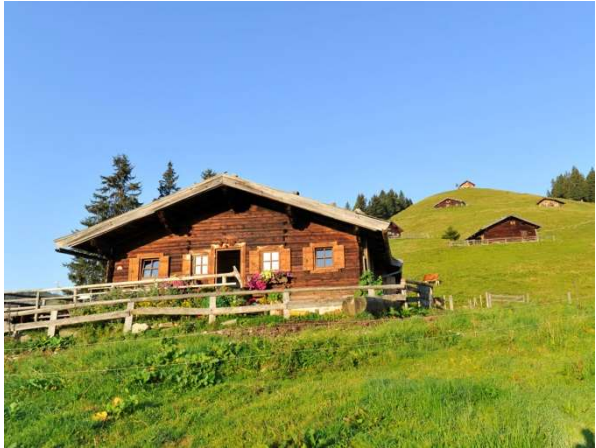
Die Vermietung von Almhütten ist unter bestimmten Voraussetzungen zulässig.

Zu berücksichtigen ist auch die Trinkwasserverordnung und das Lebensmittelrecht , siehe Kapitel 18.