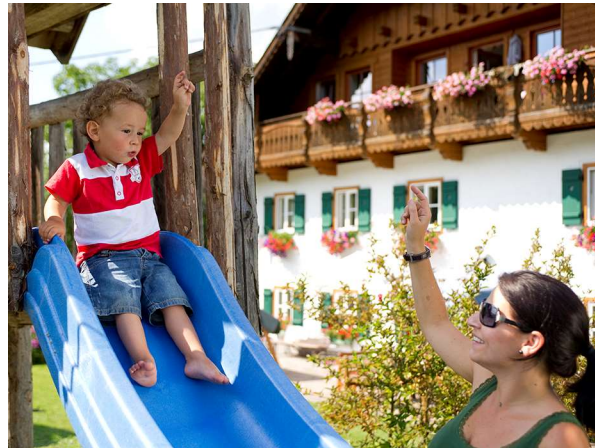
Auch im Urlaub haben Eltern eine Aufsichtspflicht.

Die Eltern haben nach dem Gesetz für die Erziehung ihrer minderjährigen Kinder zu sorgen. Die Erziehungspflicht der Eltern umfasst auch die Beaufsichtigung der Kinder mit dem Ziel, Beschädigungen dritter Personen durch die Kinder hinten zu halten. Das Maß der Aufsichtspflicht bestimmt sich stets nach dem, was angesichts des Alters, der Eigenschaften, der Entwicklung des Aufsichtsbefehligen und der wirtschaftlichen Lage des Aufsichtsführenden von diesem vernünftigerweise verlangt werden kann. Die elterliche Aufsichtspflicht einem Minderjährigen gegenüber endet (auch) im Interesse des Schutzes der Rechtsgüter Dritter nicht schon mit Eintritt dessen Mündigkeit mit 14 Jahren, sondern dauert nach Vollendung des 14. Lebensjahrs an. Die Eltern haben ein minderjähriges Kind im Rahmen ihrer Erziehungspflicht - unabhängig von seinem Alter - auch deshalb zu beaufsichtigen, um Dritte vor Schäden infolge eines vorhersehbaren schuldhaft rechtswidrigen Verhaltens des (mündigen) Minderjährigen zu bewahren.