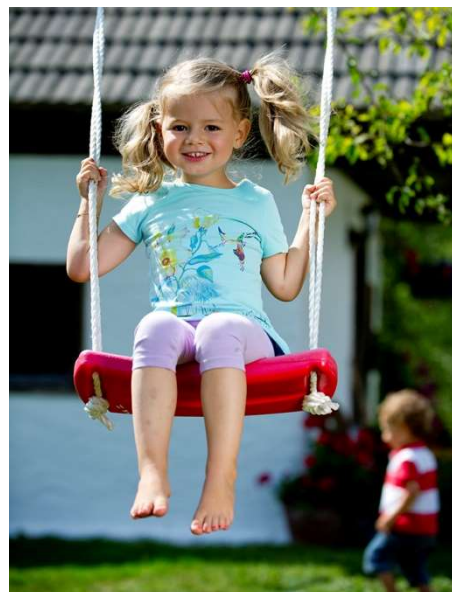
Der Spielplatzbetreiber ist verantwortlich für den ordnungsgemäßen Zustand der Spielgeräte.