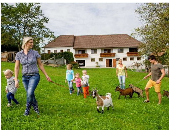
Wissensvermittlung ist erlaubt und erwünscht.

Folgende Angebote dürfen zB abgehalten werden: Malkurse, Töpferkurse, Brotbacken, Kräuterwanderung, Butter rühren, Joghurt herstellen. Im Einzelfall muss jedoch überprüft werden, ob für diesen Privatunterricht – abgesehen von der Gewerbeordnung – nicht spezielle Vorschriften existieren, wie zB die landesgesetzlichen Regelungen für Tanzschulen oder Schischulen. Diese erlauben die erwerbsmäßige Unterweisung in den Fertigkeiten des Schilaufs bzw. das Betreiben einer Tanzschule nur den Inhabern einer entsprechenden Bewilligung.