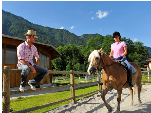
Der Vermieter muss über besondere Eigenschaften des Pferdes aufklären.

Am besten schriftlich! Der Zustand des Sattel- und Zaumzeuges bzw. des Hufbeschlages müssen überprüft sein.