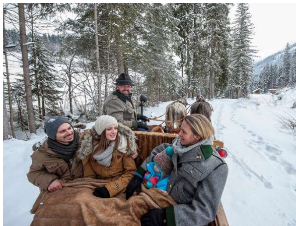
Eine Kutschenfahrt kann ein ansprechendes Angebot am Bauernhof sein.

Gemäß § 3 Abs. 1 ist die entgeltliche Beförderung von Personen mit Fuhrwerken nur auf Grund einer Bewilligung (Bezirksverwaltungsbehörde) zulässig. Allerdings bedarf die entgeltliche Beförderung von Personen im Rahmen eines Pferdewagenunternehmens, wenn dies als landwirtschaftliches Nebengewerbe ausgeübt wird, keiner Bewilligung (§ 3 Abs. 4).