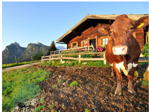
Nutztiere am Bauernhof stellen auch Gefahrenquellen dar.

Für Rinder genügt die Abzäunung mittels elektrischen Weidezaun (nicht so bei Pferden, welche ein ausgeprägtes Fluchtverhalten haben). Im Nahbereich von stark frequentierten Straßen wie etwa Autobahnen können zusätzliche Maßnahmen zB 2- bis 3-fache Drahtführung erforderlich sein. Haben jedoch Rinder den Weidezaun schon mehrmals durchbrochen, ist eine solche Verwahrung unzureichend und sind diese gesondert zu