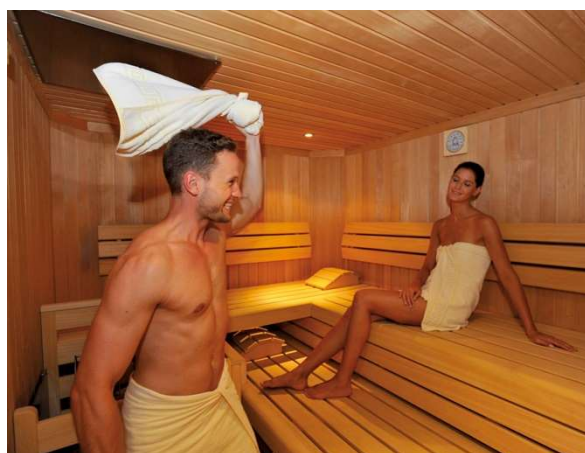
Für die Errichtung einer Saunaanlage gibt es Richtwerte.