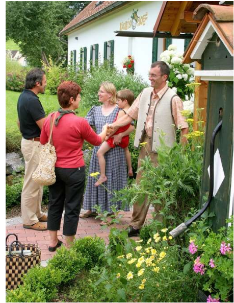
Der Vermieter geht mit seinen Gästen einen Vertrag ein.

Zu den Kernelementen eines jeweiligen Vertragstypus (zB Kauf-, Darlehens-, Miet- sowie Werksvertrag usw.) kommen in der Praxis regelmäßig sog. Nebenabreden. Dabei handelt es sich um auf den Einzelfall abgestellte, detailliertere Vertragsinhalte, welche den Parteienwillen eingehend behandeln. So ist es sicherlich notwendig bzw. vernünftig, im Rahmen des Abschlusses eines Kaufvertrages auch den Ort sowie Zeitpunkt der Erfüllung, die Modalitäten der Kaufpreisbezahlung, Fragen der Gewährleistung im Falle eines mangelhaften Kaufobjektes usw. ausführlich zu regeln. Eine dieser Nebenabreden wird wohl den Rücktritt vom jeweiligen Vertrag nach dem Eintreten vorher definierter Ereignisse betreffen, insbesondere aber auch eine Antwort darauf zu bieten haben, was zu geschehen hat, falls eine der Parteien sich nicht an den Vertragsinhalt halten sollte.