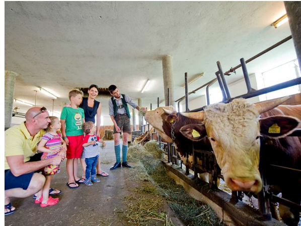
Der richtige Umgang mit Tieren muss geschult werden.

Ob und inwieweit derartige Verpflichtungen bestehen, ist nicht detailliert in Gesetzen niedergeschrieben, sondern jeweils vom Einzelfall abhangig. In einem Schadenersatzprozess wird im Nachhinein beurteilt, ob die Umzaunung einer Pferdekoppel oder die Absicherung einer Futterluke am Heuboden im Einzelfall ausreichend war oder nicht.