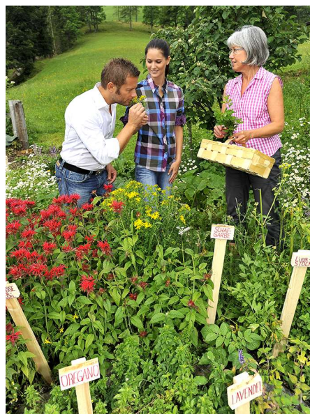
Kräuterwanderungen können ein Angebot des Urlaub am Bauernhof Betriebes sein.

Noch eine Gefahr stellt das MTD-Gesetz dar: Bei der freiberuflichen Ausübung gibt es Werbebeschränkungen. Diese betreffen nicht nur die Angehörigen der jeweiligen Berufsgruppe, sondern auch andere Personen, zB auch den Urlaub am Bauernhof Anbieter. So ist gemäß § 7b MTD-Gesetz eine dem beruflichen Ansehen abträgliche, insbesondere jedoch vergleichende, diskriminierende oder unsachliche Anpreisung oder Werbung verboten.